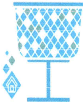
• OPCIÓN 1